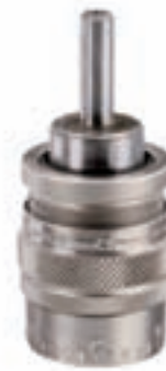
Appareil de base Basic drill cage